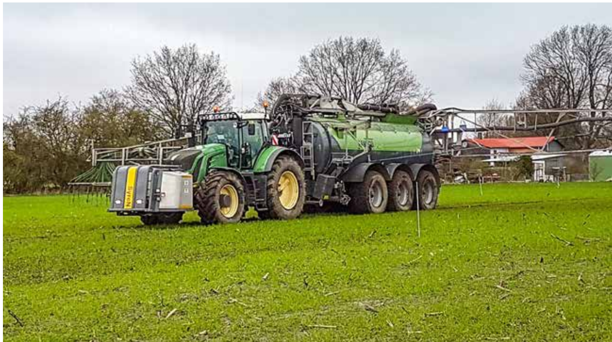
Düngung eines Triticale-Versuches mit Großtechnik in Rendswühren, Schleswig-Holstein. Im Vergleich zur Schleppschlauchausbringung ohne Ansäuerung können Ammoniakverluste nochmals reduziert werden. In Großversuchen wird die Praktikabilität der Technik überprüft.

Zum Vergleich der Kosten unterschiedlicher Vermeidungsmaßnahmen muss man die jeweiligen Kosten auf 1 kg vermiedenes Ammoniak beziehen. In den Berechnungen sind wir davon ausgegangen, dass durch die Ansäuerung 0,735 kg Ammoniak je Kubikmeter Gülle beziehungsweise Gärrest vermieden werden (siehe die Abbildung auf Seite 46). Teilt man nun die Mehrkosten der Ansäuerung (1,07 €/m 3 Gülle beziehungsweise 1,99 €/m 3 Gärrest, dies sind die Werte ohne Gegenrechnung der Düngereinsparung) durch die 0,735 kg NH 3 /m 3 , erhält man die Vermeidungskosten je Ki-