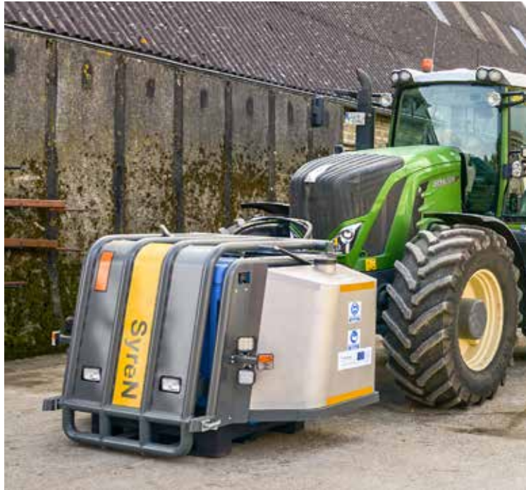
Die Schwefelsäure befindet sich in einer blauen, 1.000 l fassenden Varibox, welche in der Fronthydraulik transportiert wird. Sie wird unmittelbar vor der Applikation in den Güllestrom dosiert.

Das am Forschungsprojekt beteiligte Lohnunternehmen benutzt bei der Feldausbringung angesäuerten Wirtschaftsdüngers einen Schleppschlauchverteiler und das Syren-Ansäuerungssystem des dänischen Herstellers Biocover. Dieses System besteht aus einem Frontkäfigsystem mit einem Säuretank und der dazugehörigen Injektionstechnologie. Das Frontkäfigsystem ist am Fronthubwerk des Traktors montiert. Der Käfig besteht aus verstärktem Stahl und dient dem Schutz des Säuretanks. Der Säuretank ist ein leicht austauschbarer IBC-Container (IBC = Intermediate Bulk Container, zu Deutsch Großpackmittel), der mit Standardschnellverbindungen ausgestattet ist, um einen Säurekontakt beim Austausch auszuschließen. Alternativ können sogenannte Variboxen genutzt werden. Zusätzlich gibt es zwei weitere Tanks. Der eine ist für Zusatzstoffe wie zum Beispiel Nitrifikationshemmer vor-